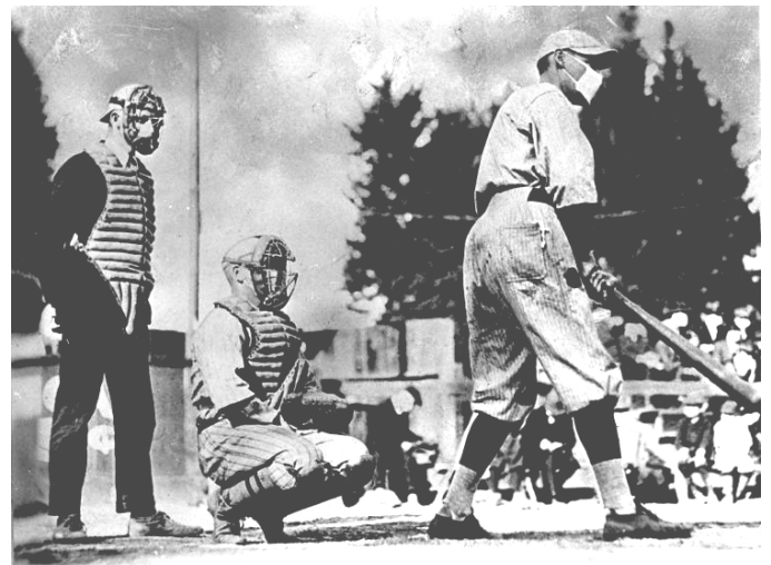
Foto scattata ai tempi dell'influenza spagnola

Sia ora con il rischio del contagio e della morte senza assistenza, sia domani e dopodomani per pagare i debiti di una classe di assassini.